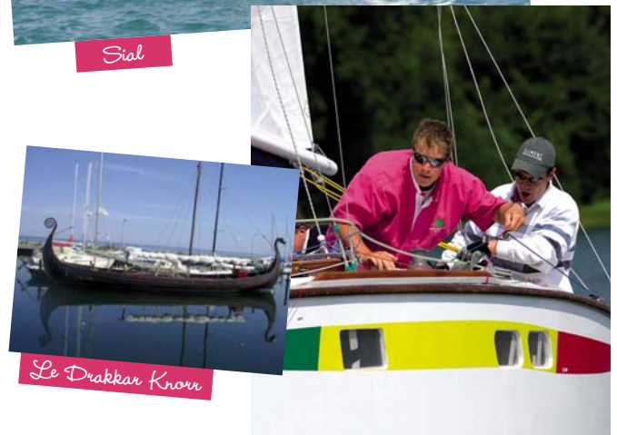
Le Drakkar Knorr