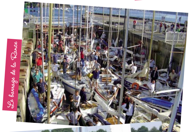
Le lavage de la Rance